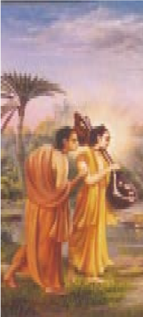
Śrī Nārada Muni, el excelso sabio que tiene vida eterna y conocimiento ilimitado, y que experimenta un gozo indescriptible. Aquí aparece acompañado de su allegado Parvata Muni.