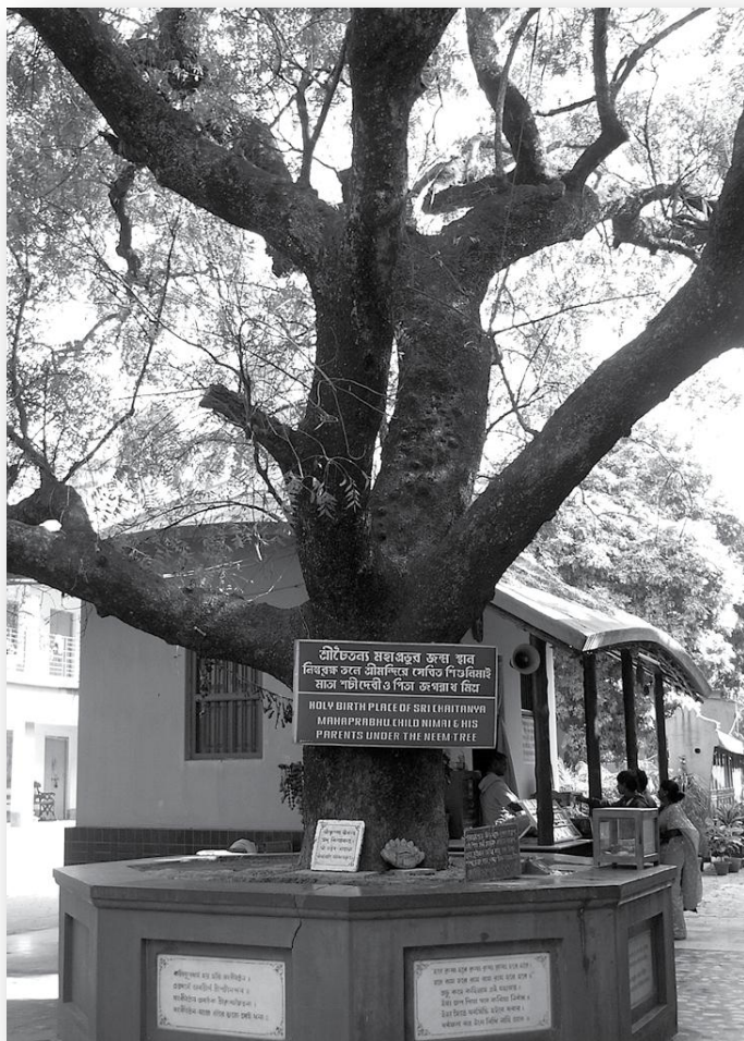
De heilige geboorteplaats van Śrī Caitanya Mahāprabhu