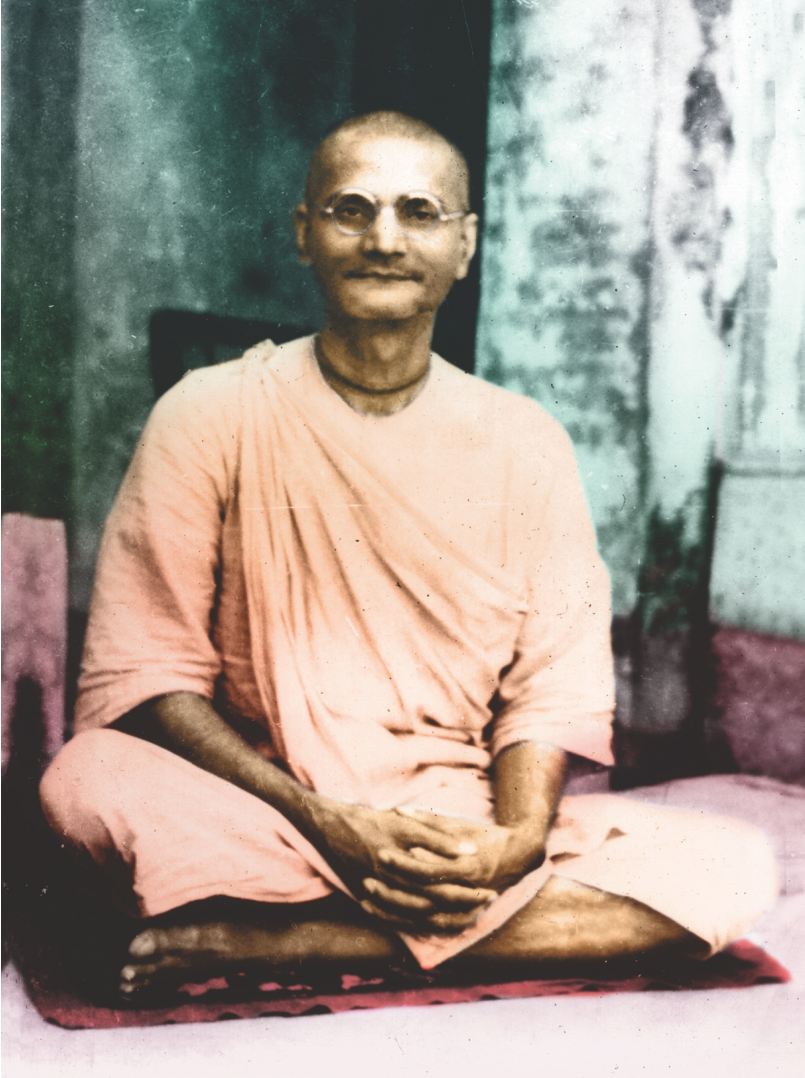
nitya-līlā-praviṣṭa om viṣṇupāda aṣṭottara-śata Śrī Śrīmad Bhaktiprajñāna Keśava Gosvāmī Mahārāja