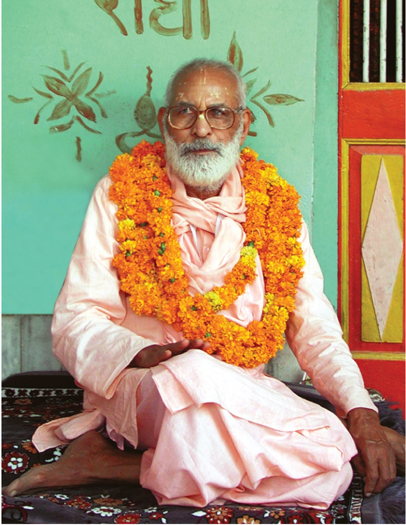
nitya-līlā-praviṣṭa om viṣṇupāda aṣṭottara-śata Śrī Śrīmad Bhaktivedānta Nārāyaṇa Gosvāmī Mahārāja