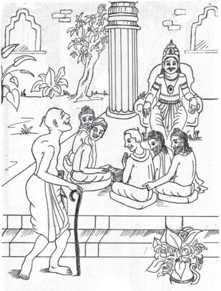
महाराज जनककी सभामें अष्टावक्र ऋषि