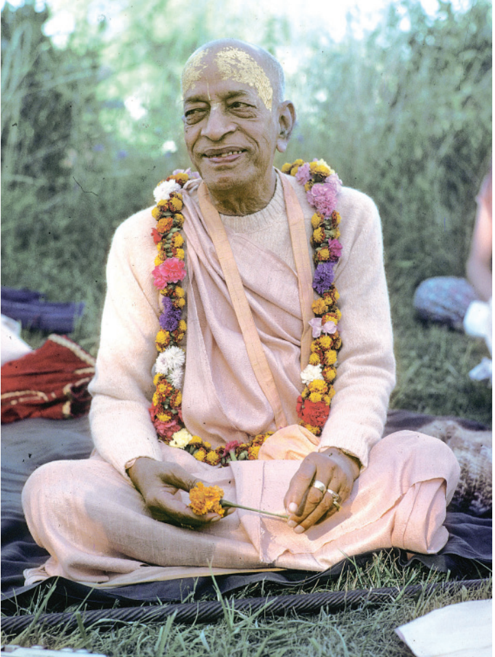
श्रीश्रीमद्भक्तिवेदान्त स्वामी महाराज